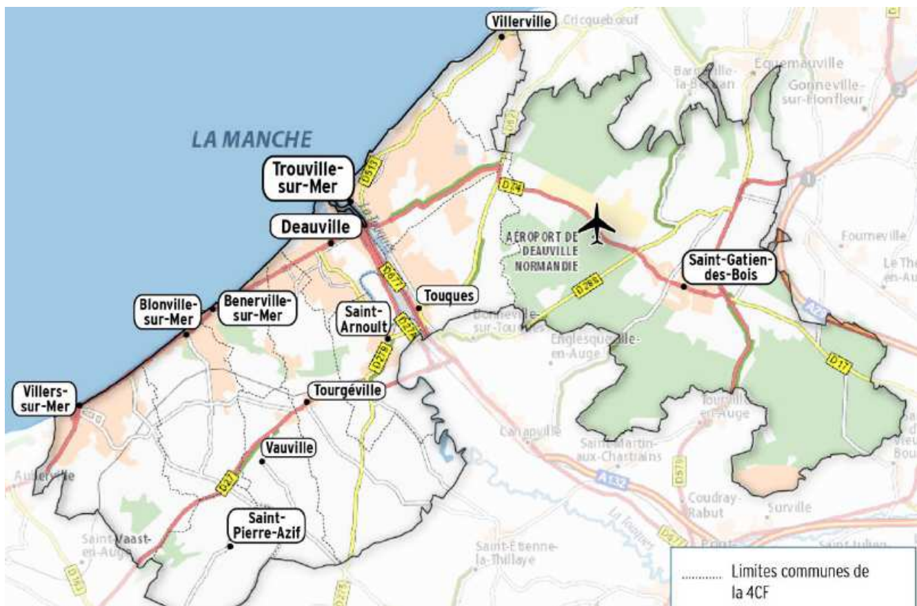
Carte de la communauté de communes Cœur Côte Fleurie (source : dossier)

Afin d'atteindre ces objectifs, la CCCCCF a mis en place un plan d'actions réparties en six orientations et une centaine de mesures.